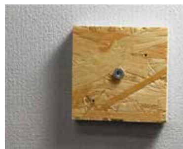
Fertig verschraubter Gegenstand