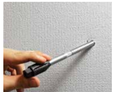
Einsetzen des Dübels Thermax 8/60 in das Bohrloch