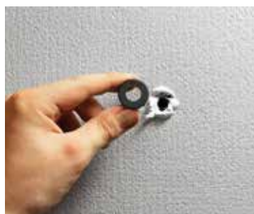
Bohrloch mit ausreichend Dichtstoff