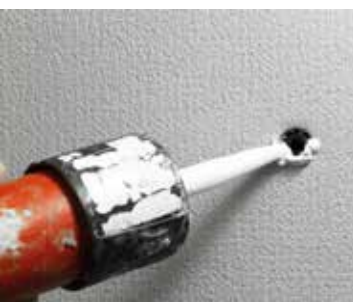
Abdichten des Dübelskopfes im Bohrloch mit StoSeal F 505